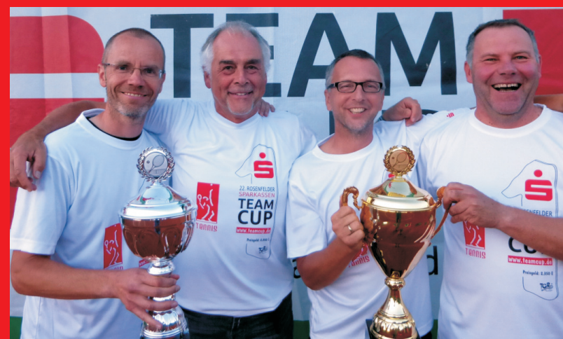
Sieger Herren 50 - Team des Gastgebers "TG Rosenfeld"

Weitere Infos und vieles mehr von den letzten Turnieren finden Sie auf www.teamcup.de und www.tgr.-online.de .