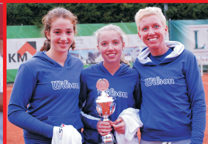
Platz 3 für die netten Waiblinger....