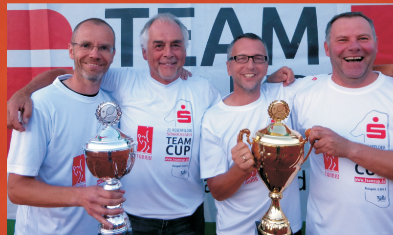
Sieger Herren 50 - Team des Gastgebers "TG Rosenfeld"

Bei den aktiven Herren besteht ein Team aus min. 4 Teilnehmern, hier werden die zwei Einzel und ein Doppel parallel gespielt. Beim Teamcup kannst Du mit Deinen Kollegen einen tollen Saisonabschluß genießen. Auch heuer werden die Macher der TG Rosenfeld wieder ein kostenloses Campieren bei Mitgliedern der TG Rosenfeld und / oder im Sportheim anbieten, so dass man sich voll auf Sport und Feiern konzentrieren kann und nicht noch teilweise lange Fahrten einplanen muß. Schon in den vergangenen Jahren sind immer wieder Teams mit dem Wohnmobil angereist, die in Rosenfeld ein tolles Tenniswochenende erlebt haben. Das wollen wir ausbauen. In nur 200 m Entfernung gibt es professionelle Wohnmobilstellplätze - direkt beim Rosenfelder Schwimmbad. Alle Teilnehmer erhalten kostenloses Essen am Samstagabend sowie in Rosenfeld täglich das sehr beliebte und kostenlose Tennis-Frühstücksbuffet von 8.00 - 12.00 Uhr (nur auf der Rosenfelder Anlage). Weitere Infos und vieles mehr von den letzten Turnieren finden Sie auf www.teamcup.de und www.tgr.-online.de .