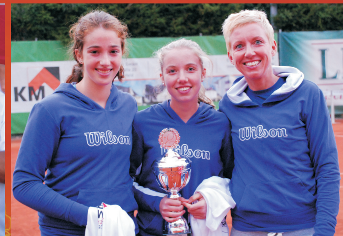
Platz 3 für die netten Waiblinger....